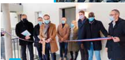
Inauguration du 27 octobre dernier.