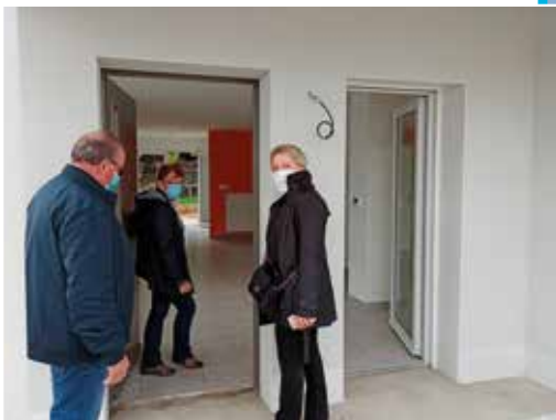
De nombreux visiteurs pour cette porte ouverte.

(cabinet médical) et commerces (pharmacie, supermarché...) à 5 mn à pied du centre bourg. Le 8 octobre a eu lieu une porte ouverte du chantier pour permettre aux futurs locataires et intéressés de découvrir les logements en finition. Ces visites ont été très appréciées et ont permis de rassurer sur les prochains déménagements.