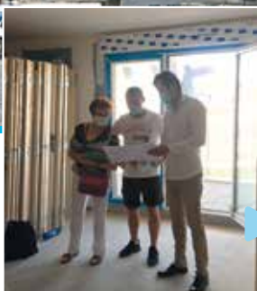
De futurs acquéreurs découvrent leur logement.

Les bâtiments A et B -ceux à gauche de l'église- sont presque achevés. Ils comportent 5 surfaces commerciales en rez-de-chaussée et 25 appartements dont 14 en vente.