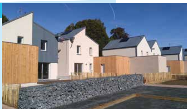
● Les Villas Colbert.

Ces différents statuts (locataire/propriétaire, nouvel accédant/investisseur)... ont pour objectif de favoriser la mixité sociale à l'intérieur d'un même quartier.