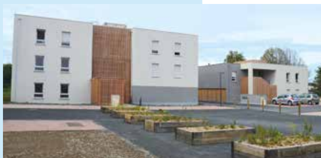
● Les résidences Mazarine.