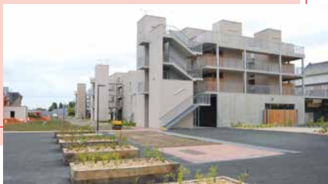
● Résidence Leny Escudero.

portées : tous les logements bénéficient d'une orientation permettant d'obtenir des capacités thermiques meilleures qu'un bâtiment basse consommation (BBC), la norme de construction actuelle.