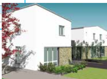
Livraison prévisionnelle : 1 er trimestre 2018 Architectes : A. Gicquel et A. Morin